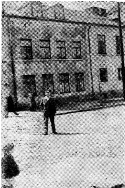
Una casa en el Viejo Mercado en Kutno

También existía una sociedad activa que aseguraba que hubiera algo de comida en los hogares pobres. Para ello, la población judía pagaría dinero semanalmente. Tuve la oportunidad de visitar a estos activistas comunitarios que hacían su trabajo en silencio, sin fanfarrias. Fueron llamados "Atendiendo fielmente a las necesidades del público".