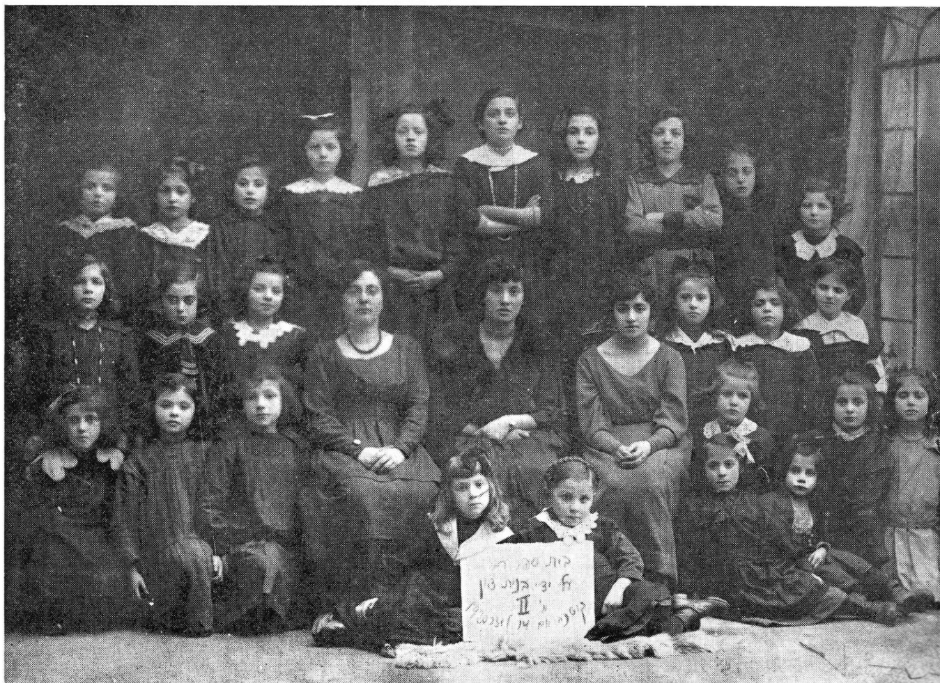
Alumnas de la escuela "Banot Zion" (1920)