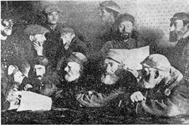
Personajes de Kutno

alumnos, sino que también los padres lo apreciaban y respetaban por la amabilidad de su comportamiento y modestia. En 1925 emigró a Israel con su familia y continuó enseñando en la escuela de Raanana. Murió en 1963 dejando dos hijos, ambos escritores: Aharon y Matti Megged.