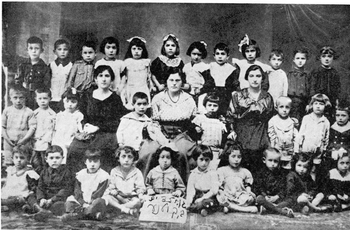
Guardería en Kutno