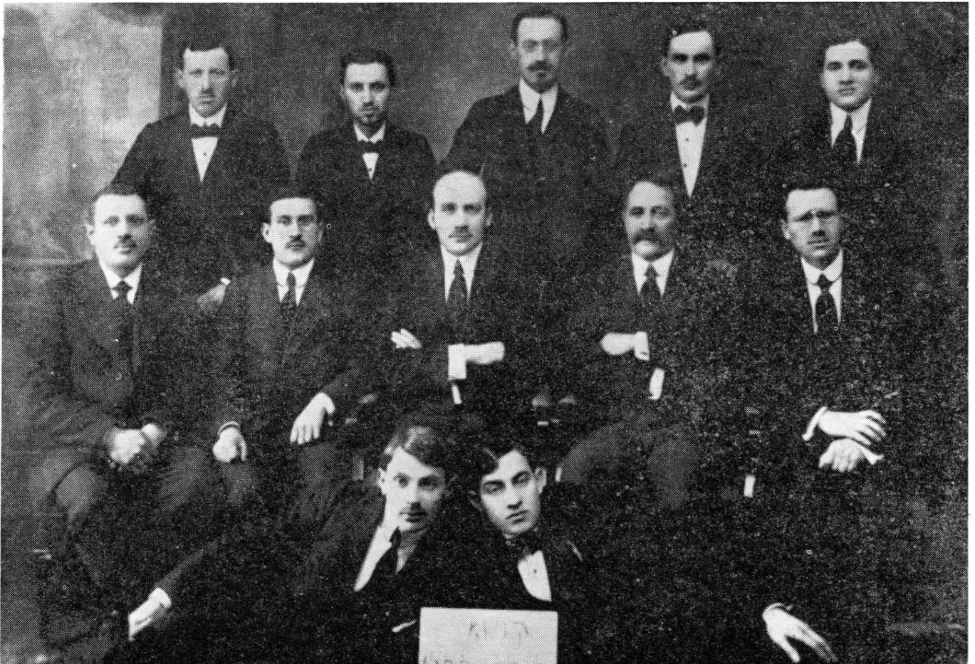
Primer comité sionista en Kutno