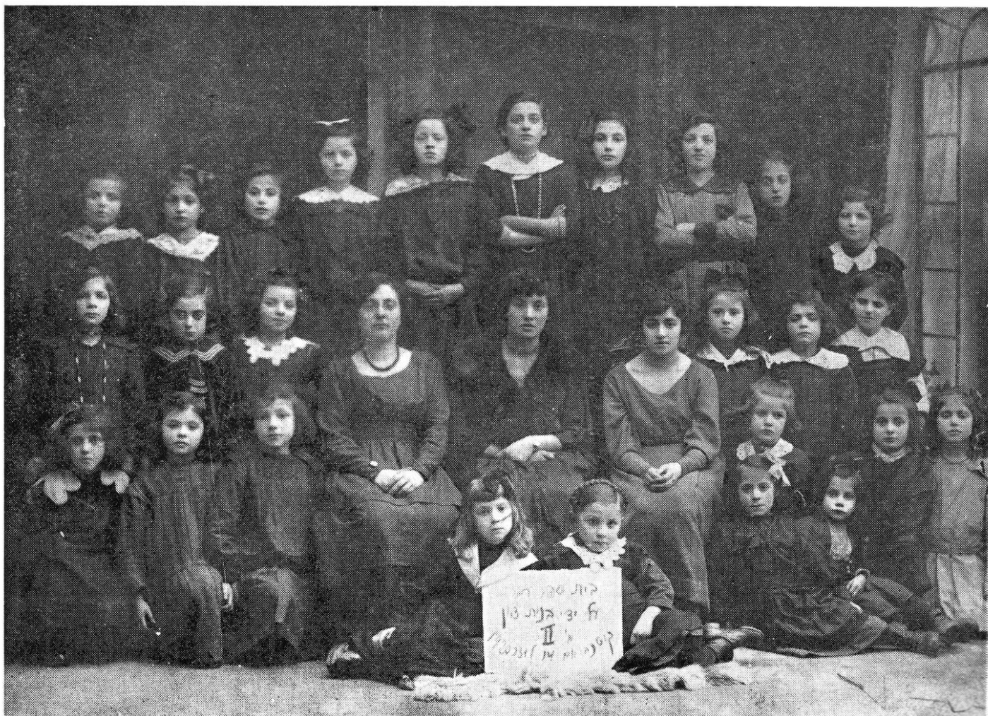
Elèves de l'école "Banot Zion" (1920)