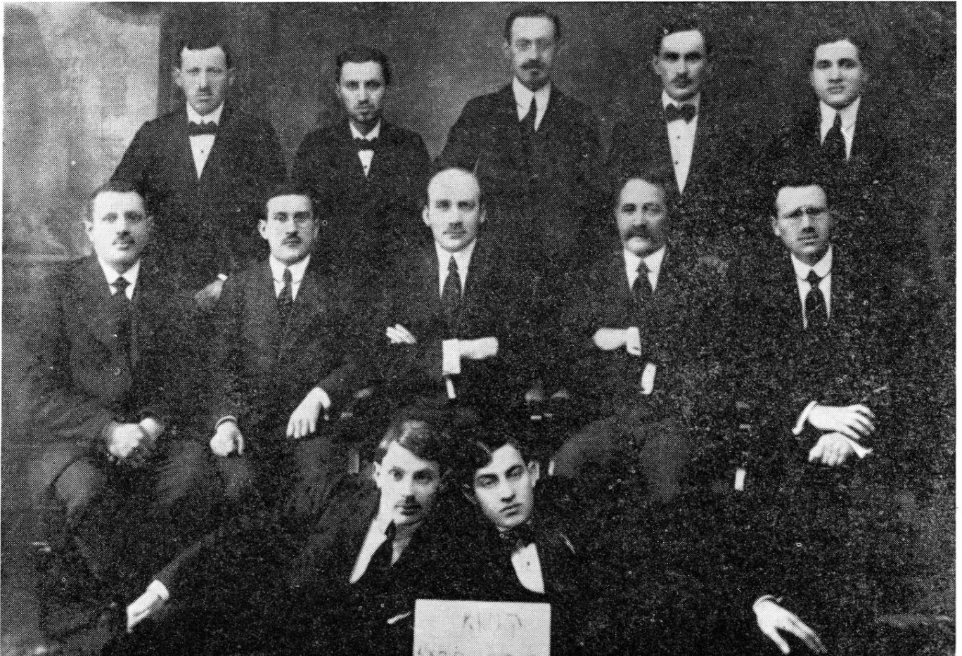
Premier comité sioniste à Kutno