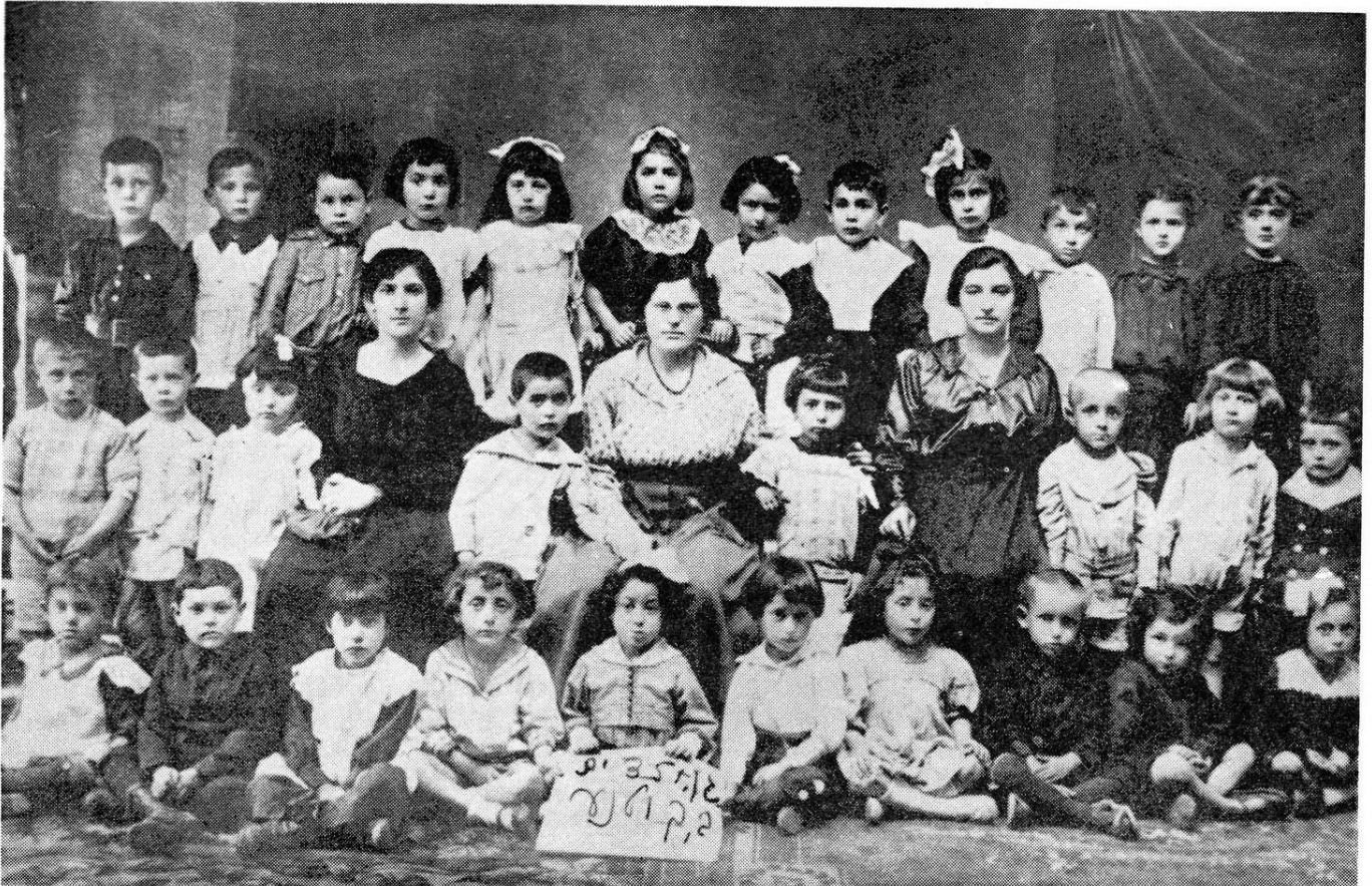
Maternelle à Kutno