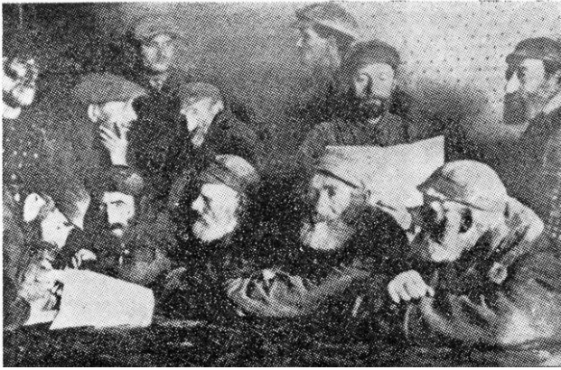
Personnages de Kutno

et le bon sens, et pendant ses études à la yeshiva il se consacra à l'apprentissage de la langue et de la littérature hébraïques. À l'école " Am HaSefer ", il a enseigné avec amour et en connaissance de cause les sujets de la Bible, du Talmud et de l'histoire du peuple juif. Il aimait beaucoup ses élèves, car il savait acquérir leur cœur et leur intérêt dans les professions qu'il enseignait. Et non seulement il aimait les élèves, mais aussi les parents l'appréciaient et le respectaient pour la douceur de son comportement et sa modestie. En 1925, il a immigré en Israël avec sa famille et a continué à enseigner à l'école de Raanana. Il est mort en 1963 laissant deux fils, tous deux écrivains – Aharon et Matti Megged.