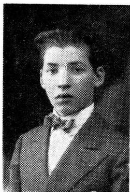
Membre du Beitar Gwircman, qui s'est noyé pendant un entraînement à Iwacewicze

Parmi les principaux collègues de ces temps passés, on peut citer :