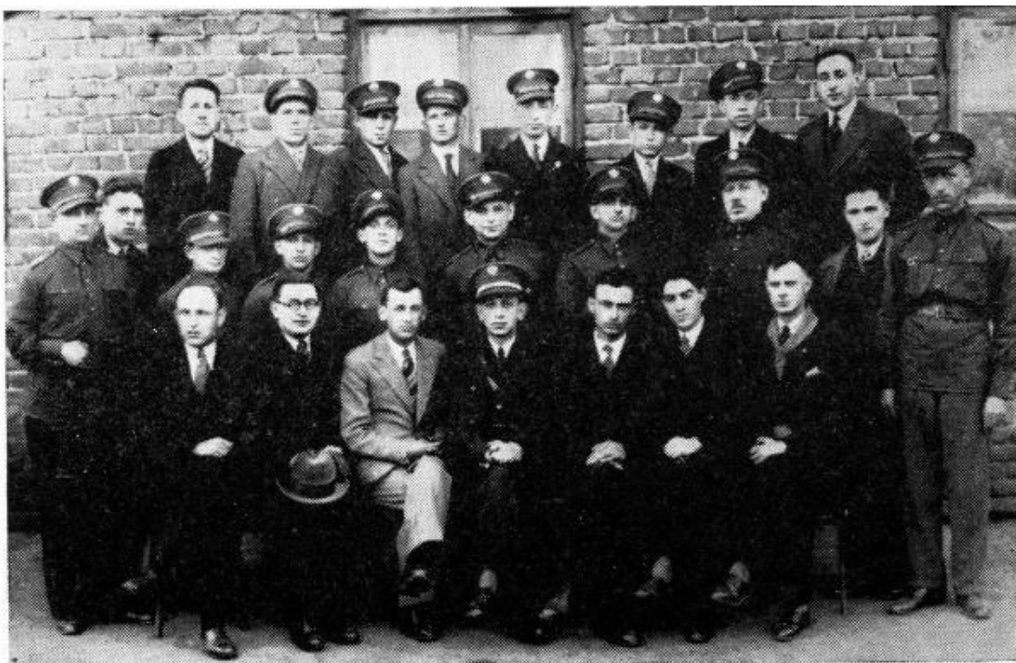
Union des Soldats – 1932