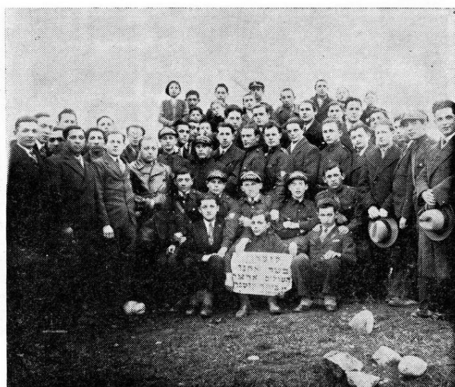
Branche du Beitar – 1930

Au fur et à mesure que les travaux avançaient, nous avons approché le conseil d'administration du lycée hébraïque de Kutno, qui a accepté de nous allouer