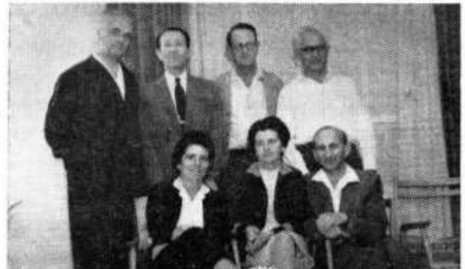
Arriba: grupo de miembros del HaShomer HaZair en Kutno, en 1926. Abajo: mismo grupo en Tel Aviv, 1962