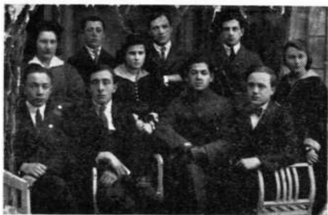
Grupo de mayores del HaShomer HaZair

hogares pequeñoburgueses, a jóvenes de liceo, que estaban lejos de una conciencia judía nacional. Años más tarde, a medida que crecimos, nos preguntamos sobre este fenómeno. Esto puede deberse a la exigencia más seria y profunda que este movimiento imponía a los niños judíos. Les exigía más profundidad, más reflexión sobre todos los problemas de la vida y de la sociedad, no aceptar cosas pactadas y aceptadas sobre nada. Sólo jóvenes con un nivel intelectual superior al resto de la juventud judía en las ciudades judías de los años 30 en Polonia.