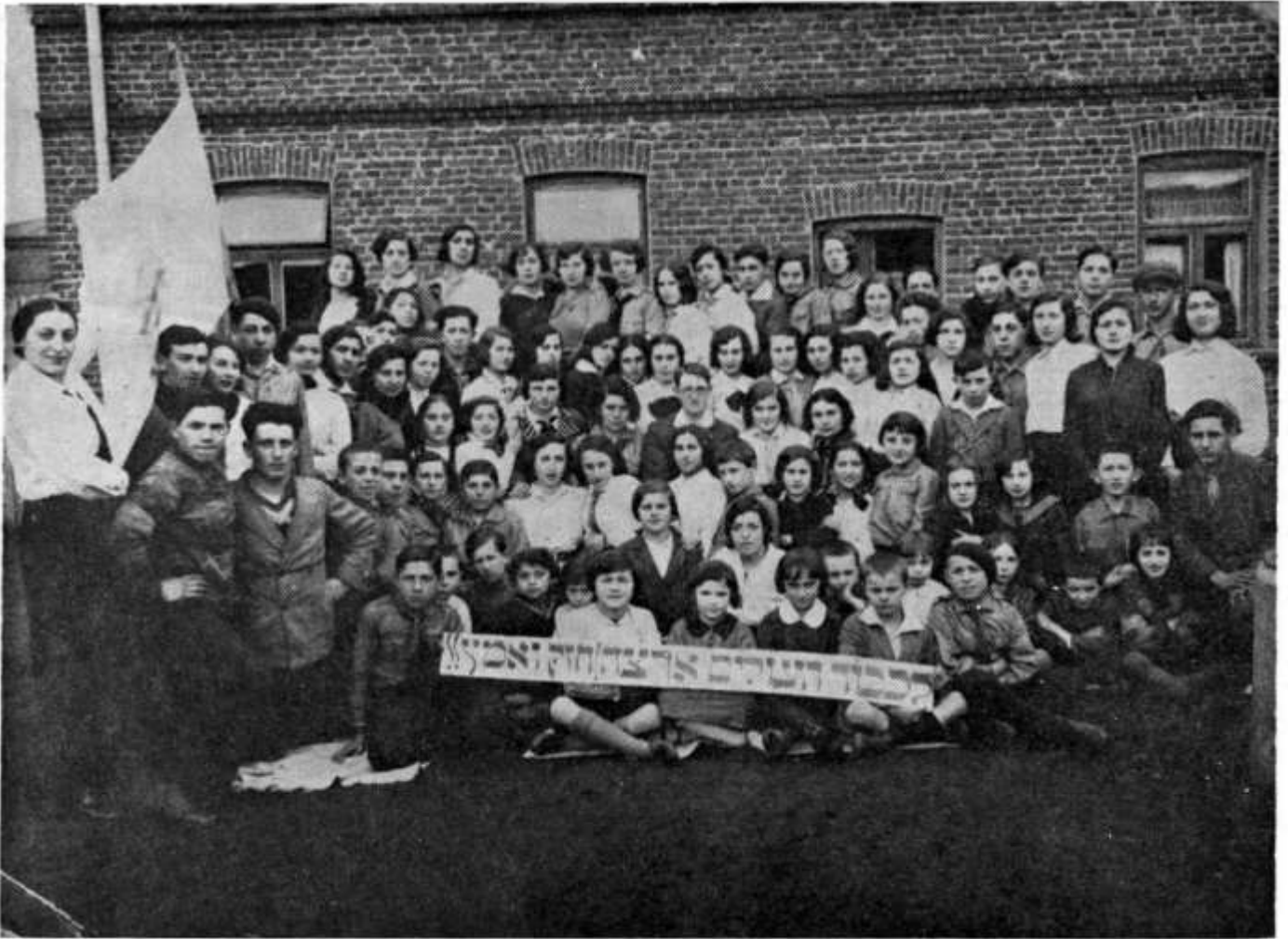
" Fuerza y coraje" – En honor a los emigrantes del "HaShomer HaZair" de Kutno