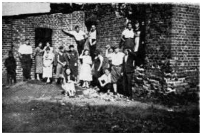
En el 'nido'

Curiosamente, un movimiento como Beitar extrajo su poder de los jóvenes de familias de clase trabajadora, mientras que HaShomer HaZair recurrió a jóvenes de