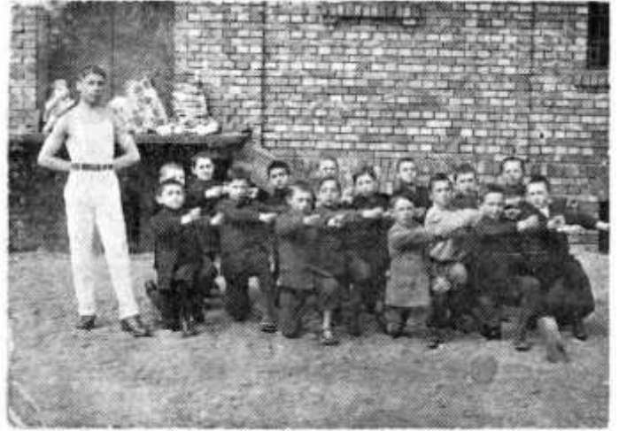
Groupe d'enfants du "Maccabi" (1922)