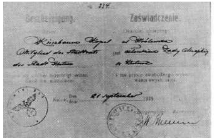
German certificate for K. Kirszbaum of September 21st, 1939

gymnastique, acrobatie. Et Kopel lui-même a été impliqué jusqu'à la tête dans les préparatifs.